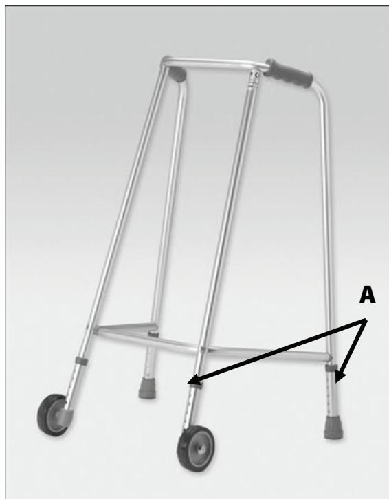
Umístění aretačních pojistek