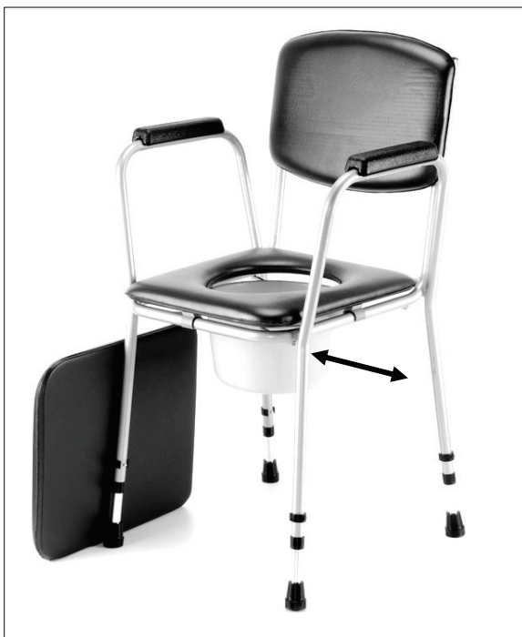
Vysunutí/zasunutí plastové nádoby

Pro použití křesla sundejte polstrovaný sedák a odstraňte víko plastové nádoby. Nádobu pak lze vysunout z držáků pod hygienickým prkénkem do pravé nebo levé strany. U modelu 521 W lze tahem nahoru velmi jednoduše vysunout područku pro lepší nasedání.