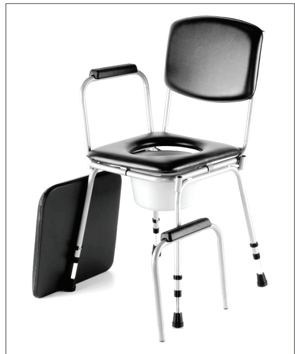
Vysunutí područky (pouze model 521 W)