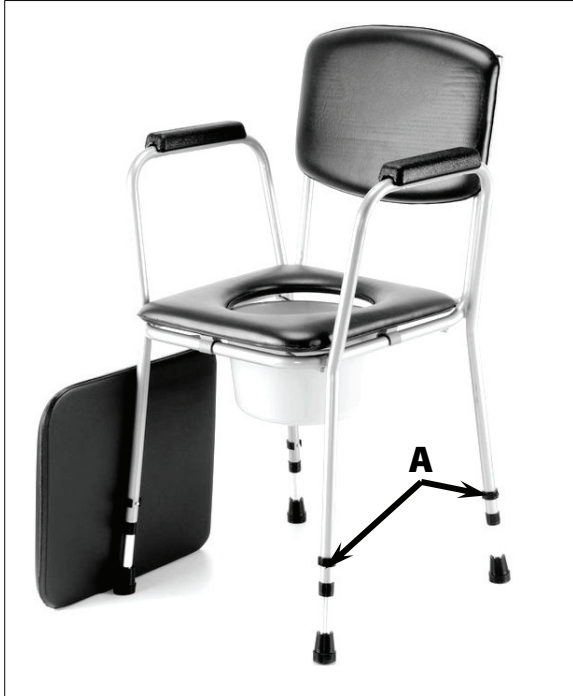
Umístění aretačních pojistek

Pro nastavení výšky křesla vyjměte aretační „E“ pojistku (A) a tahem/tlakem nastavte požadovanou délku nohy. Ve zvolené poloze pojistku zasuňte zpět. Tento postup opakujte u všech čtyř nohou.