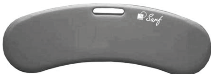
Vrchní plocha pro přesun

Prkno stabilně umístěte na dva taktéž stabilní opěrné body tak, aby vzdálenost mezi nimi nepřesahovala 30 cm (viz bezpečnostní upozornění). Protiskluzové nálepky směřují dolů a celou svou plochou se dotýkají podkladu. Držadlo směřuje dopředu. Přesun provádí po desce pacient sám nebo s pomocí asistenční osoby.