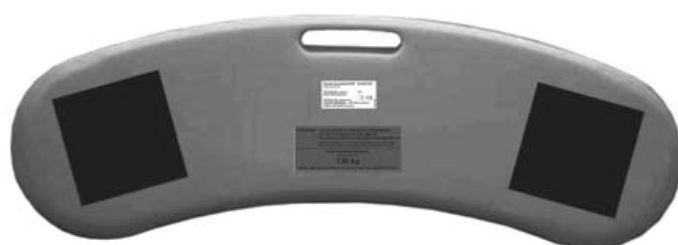
Spodní plocha s protiskluzovými nálepkami