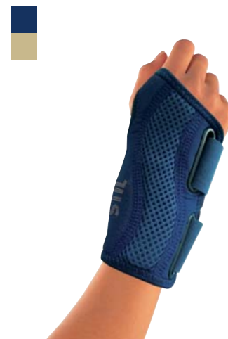
2A Bandáž zápěstí s výztuhou 04/0011527 PLNĚ HRAZENO

Indikace: Léčba a prevence distorze a kontuze zápěstí a metakarpální oblasti a při přetížení distálního předloktí.