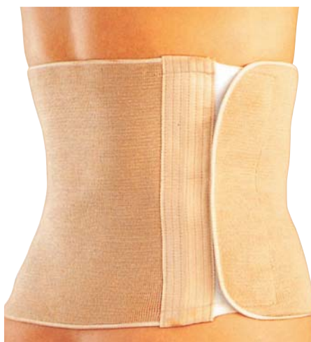
9 Pás bederní na suchý zip 04/0078027–30