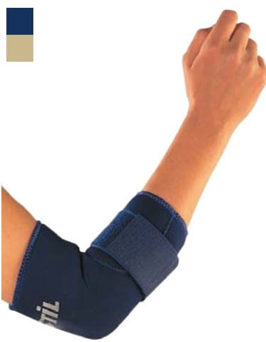
3 Bandáž lokte 04/0078033 PLNĚ HRAZENO

Indikace: Léčení pooperační bolesti, revmatické bolesti a zánětu šlach s nutností fixace palce.