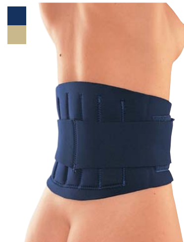
6 Pás bederní zesílený 04/0078044

Indikace: Léčba a prevence akutních i chronických bolestí páteře, poranění svalů v oblasti zad, břicha, ledvin, při revmatických obtížích a poruchách správného držení páteře.