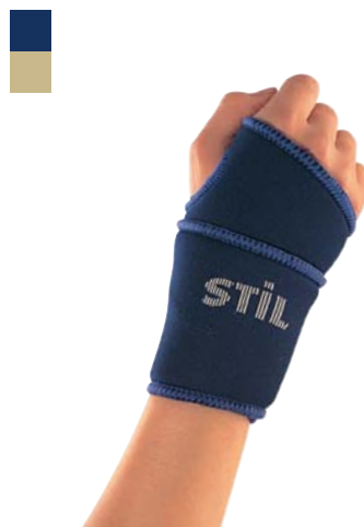
2 Bandáž zápěstí s návlekiem na palec 04/0078032 PLNĚ HRAZENO

Indikace: Léčba a prevence distorze a kontuze zápěstí.