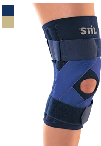
13 Bandáž kolena 04/0078042

Indikace: Léčba a prevence přetížení a instability kolenního kloubu, kontuzí, postižení vazů, femoropatelárních syndromů, patelární chondropatie, myotendopatie, otoků a degenerativních onemocnění.