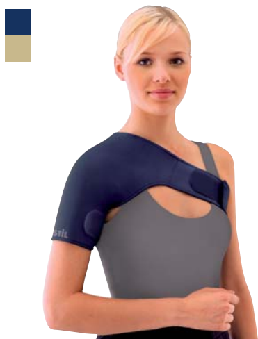
4 Bandáž ramenního kloubu 04/0078045