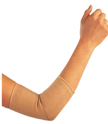
2 Bandáž lokte 04/0078049