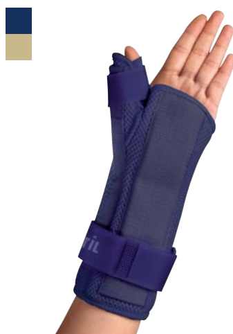
2B Bandáž zápěstí s fixací palce

Indikace: Léčení pooperační, revmatické bolesti a zánětu šlach.