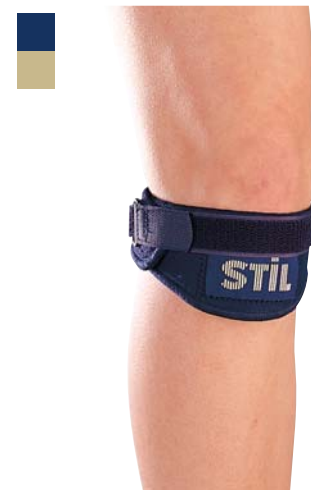
17 Infrapatelární páska 04/0093302

Indikace: Léčba a prevence přetížení a bolestí stehenních svalů.