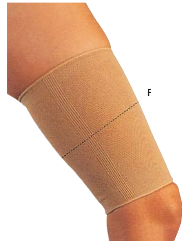
3 Bandáž stehna 04/0078050