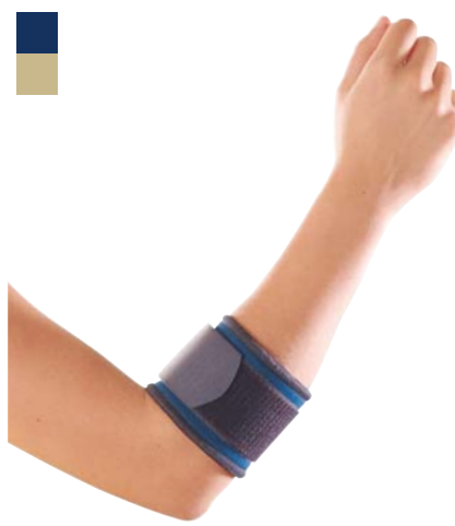
18 Epikondylární páska 04/0093303 PLNĚ HRAZENO

Indikace: Léčba a prevence radiální epikondylitidy (tenisový loket), ulnární epikondylitidy (golfový loket), po úrazech (distorze, kontuze) a chronických stavů (burzitidy, tenditidy apod.)