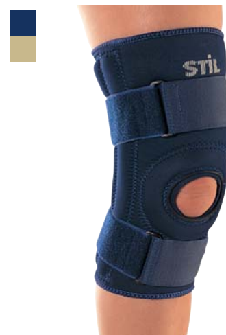
11 Bandáž kolena 04/0078040

Indikace: Léčba a prevence přetížení kolenního kloubu, kontuzí, postižení vazů, femoropatelárních syndromů, patelární chondropatie, myotendopatie, otoků a degenerativních onemocnění.