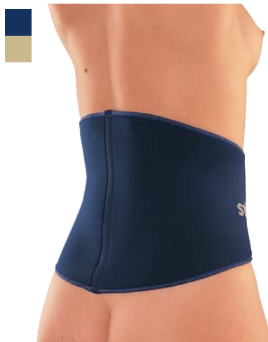
5 Pás bederní na suchý zip 04/0078043

Indikace: Léčba a prevence úrazů (poranění svalů a šlach, dislokace, distorze, kontuze) a při chronických stavech (burzitidy, tenditidy apod.).