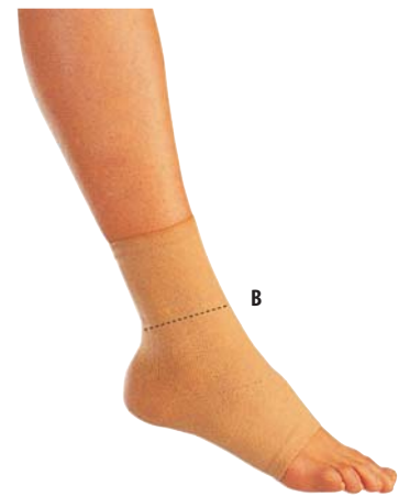
5 Bandáž kotníku 04/0078047