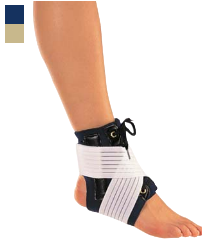
16 Bandáž kotníku šněrovací 04/0078036

Indikace: Léčba a prevence přetížení a poranění hlezenního kloubu (distorze, kontuze) a degenerativních nemocnění.