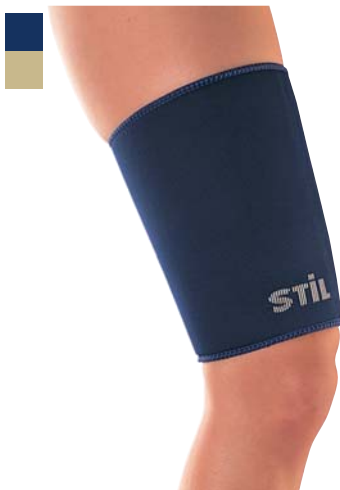
8 Bandáž stehna 04/0078034

Indikace: Léčba a prevence přetížení a poranění svalů v oblasti lýtka.