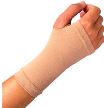
1A Bandáž zápěstí s návlekiem na palec