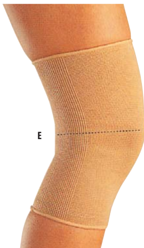
4 Bandáž kolena 04/0078046