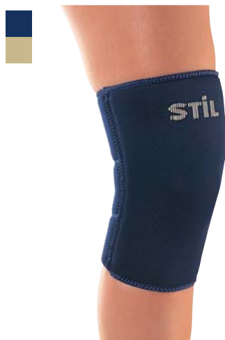
9 Bandáž kolena 04/0078038