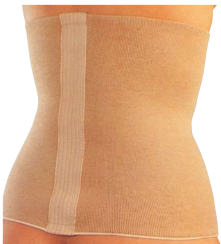
8 Pás bederní navlékací

Indikace: Léčba a prevence akutních i chronických bolestí páteře, poranění svalů v oblasti zad, břicha, ledvin, při revmatických obtížích a poruchách správného držení páteře.