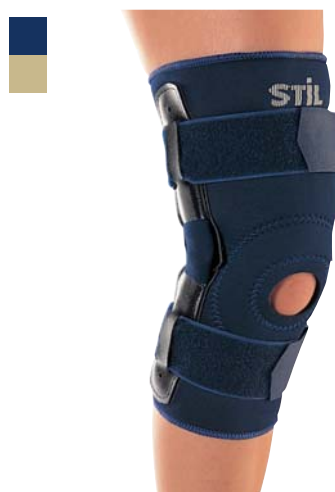
12 Bandáž kolena 04/0078041

Indikace: Léčba a prevence přetížení a poranění kolenního kloubu, především instability při postižení zkřížených vazů.