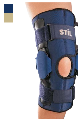
12A Bandáž kolena 04/0011528

Indikace: Léčba a prevence přetížení a poranění kolenního kloubu, především instability při postižení postranních vazů.