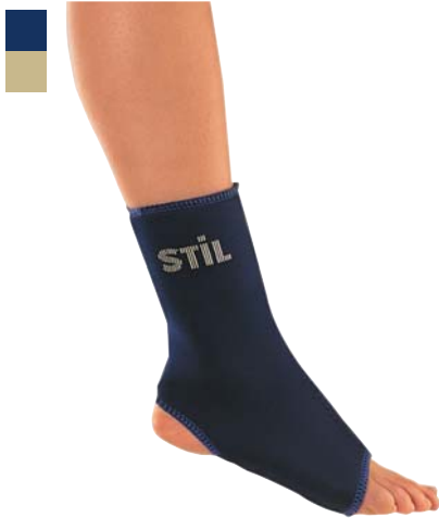
15 Bandáž kotníku navlékací 04/0078035