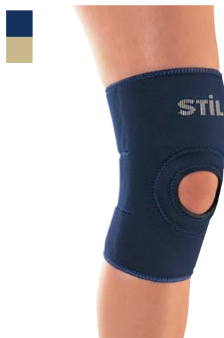
10 Bandáž kolena 04/0078039

Indikace: Léčba a prevence přetížení kolenního kloubu a degenerativních onemocnění.