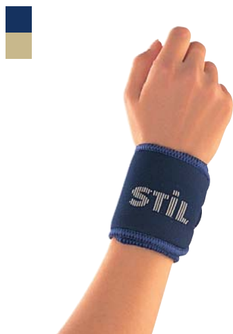
1 Bandáž zápěstí 04/0078031 PLNĚ HRAZENO