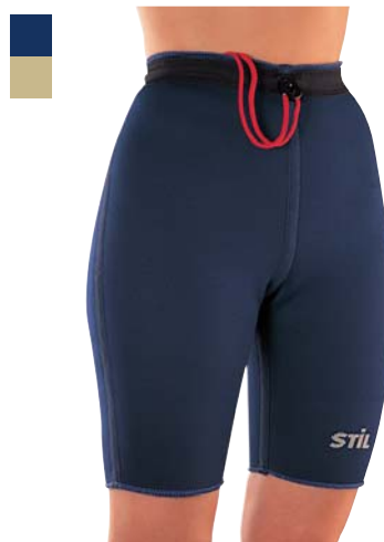
7 Kompresivní kalhoty

Indikace: Léčba a prevence přetížení a poranění svalů a šlach v oblasti stehna.