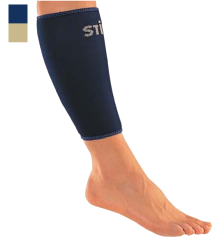
14 Bandáž lýtka 04/0078037

Indikace: Léčba a prevence přetížení a poranění hlezenního kloubu (distorze, kontuze) a degenerativních onemocnění.