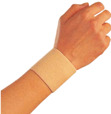
1 Bandáž zápěstí elastická 04/0078051