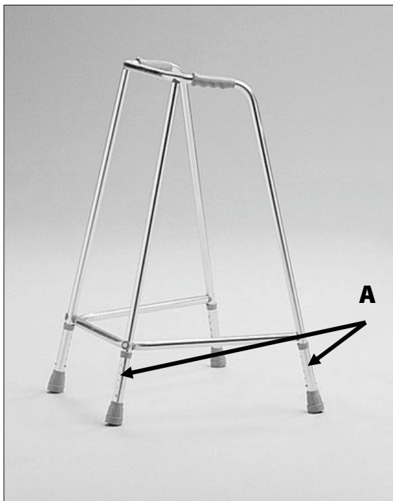
Umístění aretačních pojistek