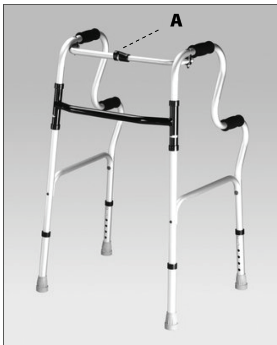
Bezpečnostní pojistka složení rámu.