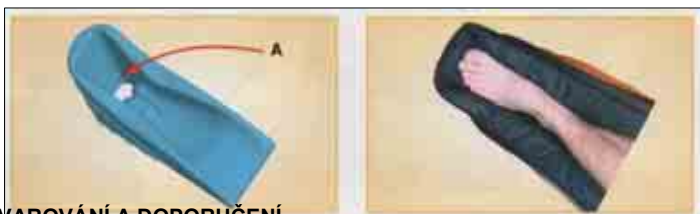
Obr. 3 (P 903, P904)