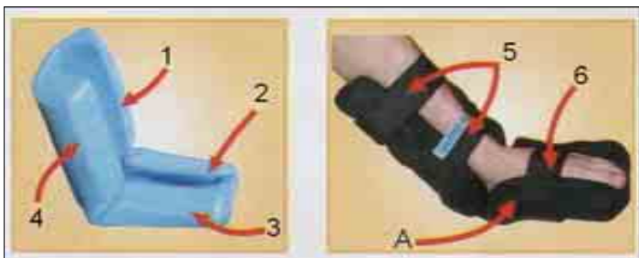
Obr. 1 (P 901)