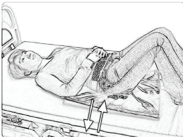
Lze použít pod kyčle a kostrč pro přesun pacienta do strany.