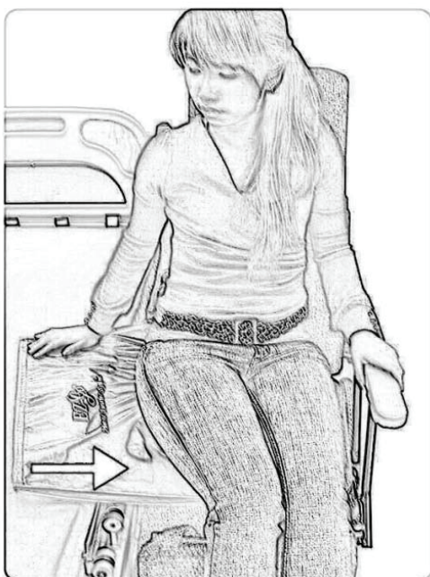
Lze použít pro přesun pacienta z vozíku na vozík