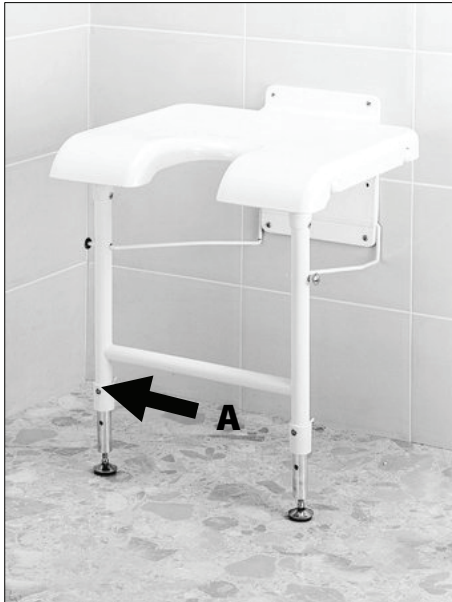
Nastavení výšky sedu

Před připevněním sedačky ke zdi si vyměřte a nastavte požadovanou výšku sedu. Pro nastavení této výšky vytáhněte aretační „E“ pojistku (A), tahem/tlakem nastavte požadovanou délku nohy a tím i výšku sedu. Pojistku zasuňte zpět. Tento postup opakujte i u druhé nohy.