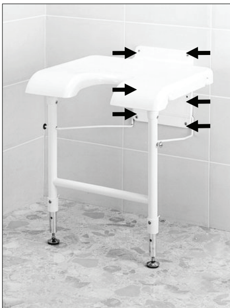
Montáž sedačky ke zdi

Sedačka se připevňuje do sprchy šesti šrouby do nosné konstrukce. Pro upevnění použijte samořezné šrouby o průměru 10 mm a hmoždinky zvolte podle druhu materiálu zdi, do které chcete upevnit sedačku. Sedačka by měla být vodorovně.