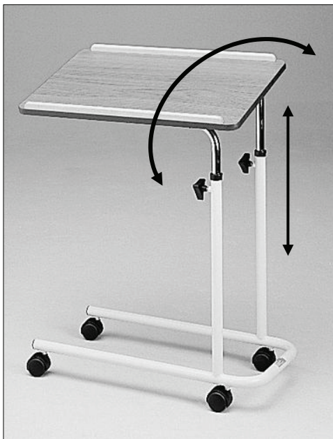
Nastavení výšky a úhlu pracovní desky