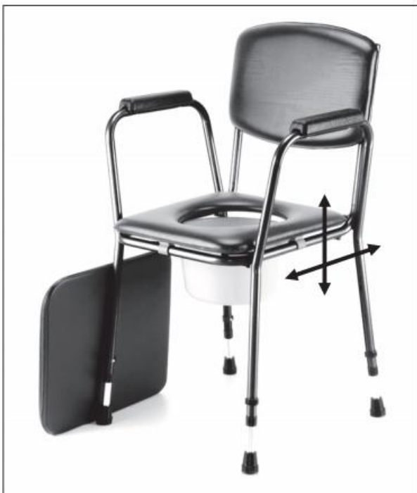
odstranitev / vstavitev plastične posode

Pred uporabo stola najprej odstranite oblazinjeno sedalo in pokrov posode. Plastično posodo odstranite od zadaj, ali pa dvignite sedežni obroč. Za udobnejše sedanje pritisnite varovalko B in odstranite naslon za roke.