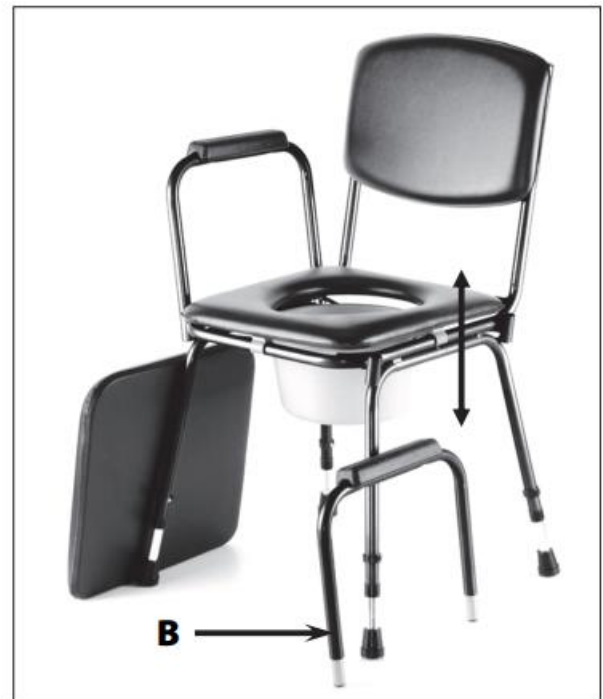
odstranitev naslona za roke